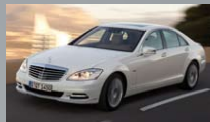
Auch ab sofort bei Brüggemann zu bewundern: Die neue E-Klasse Coupé und die innovative S-Klasse S 400 HYBRID.