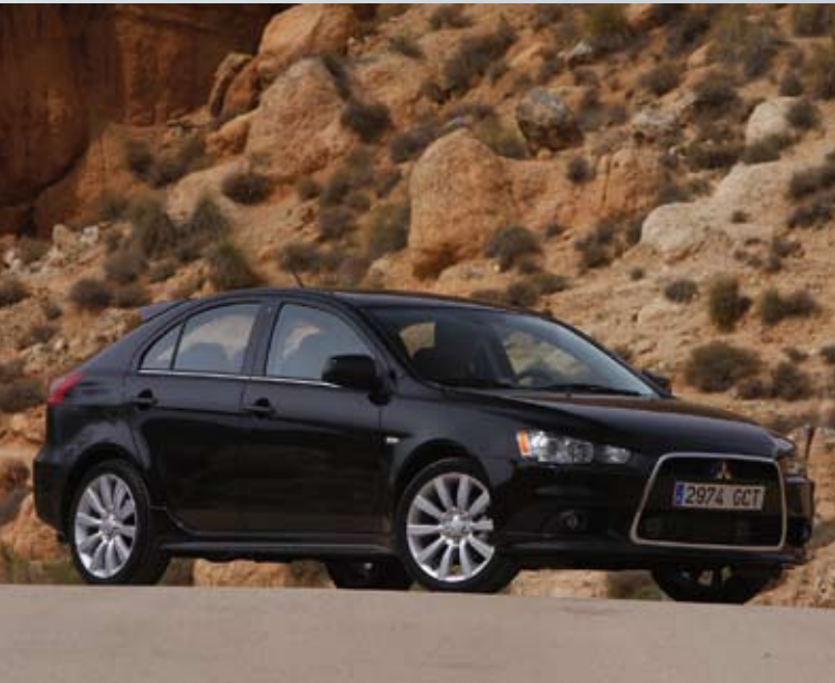
Sportliches Fließheckmodell: Lancer Sportback