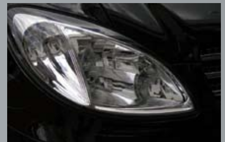
Beispiel: Chrombedampfte Glühlampen für Front- und Heckleuchten