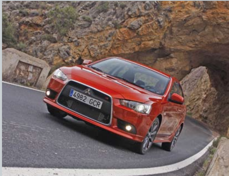
Sport- und leistungsbetont: Der Lancer Ralliart