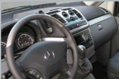
Beispiel: Vito mit Cockpit-Dekor Silverstone

sowie sonstigem Interieur durch. Haben Sie Interesse? Rufen Sie uns an, wir veredeln auch Ihren Mercedes: 02103-36120.