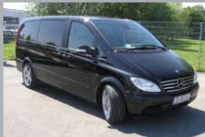
Beispiel: Viano V6 mit Alufelgen Rondell Typ 0048 Silber